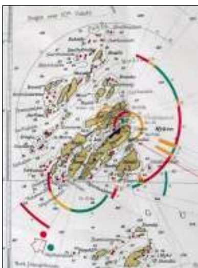
Utsnitt av sjøkart nr. 63, som viser Myken og øyene omkring. Myken fyr er et ledfyrtårn, ble tatt i bruk i 1917 og er fortsatt i drift i den mørke årstida.

Myken finnes på sjøkart nr 63, M=1:50 000, men dette er ikke vedlagt, da vi ikke har kopimaskin som kan ta så store formater. Videre finnes Myken i Økonomisk kartverk for Nordland, M=1:5000, Blad Finnøya DH 204-5-4.