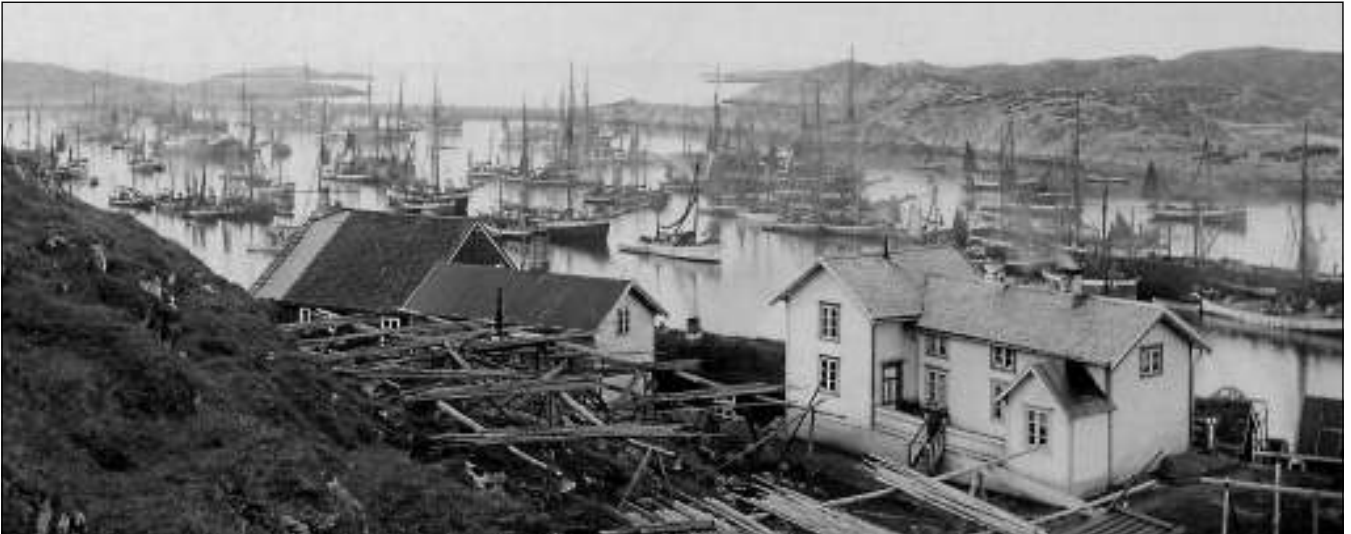
Kjøpefartøyer på havna under "sildhausten" 1915. Det er søndag; røyken viser at det kokes middag både på land og om bord.

Isblokkene måtte knuses eller deles opp i mindre biter for å kunne brukes. Til å begynne med ble det brukt en isgaffel av stål, med skarpe tenner, som en hogg inn i kanten av blokkene. Denne er dessverre ikke bevart, heller ikke iskverna som avløste den noen år senere.